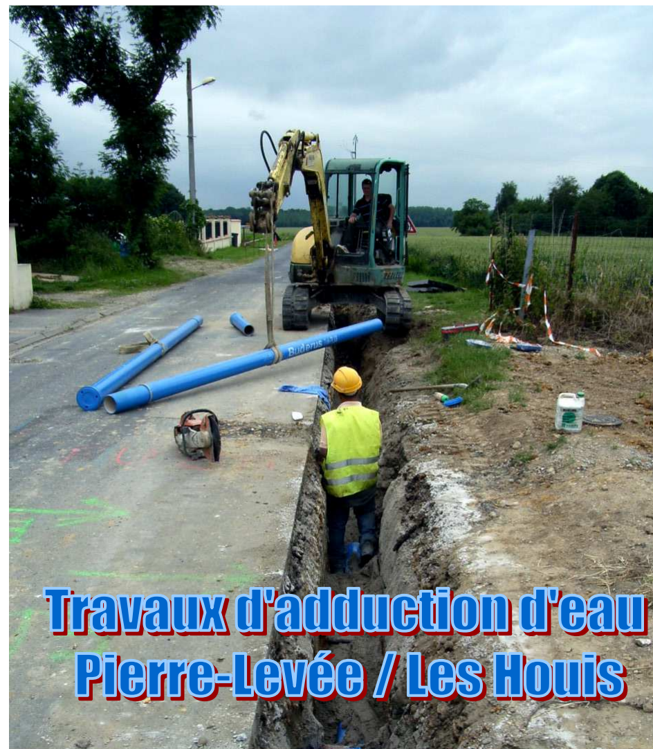
Travaux d'adduction d'eau Pierre-Levée / Les Houis

MAIRIE - 01 60 22 29 04. Fax : 01 60 22 15 00. Email : mairie-pierre.leevee@wanadoo.fr Site internet : www.pierre-leevee.fr OUVERTURE AU PUBLIC : Le mardi de 14h00 à 17h00 – Le samedi : de 9h00 à 12h00 AGENCE POSTALE ouverte du lundi au samedi de 11h00 à 12h30. BULLETIN MUNICIPAL : Ce journal a été réalisé par la Commission Communication. Vous pouvez envoyer vos articles ou vos commentaires à journal@pierre-leevee.fr